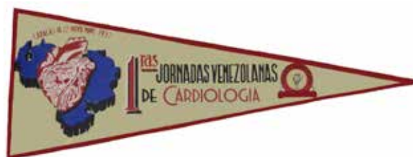
Banderín de las Primeras Jornadas Venezolanas de Cardiología.