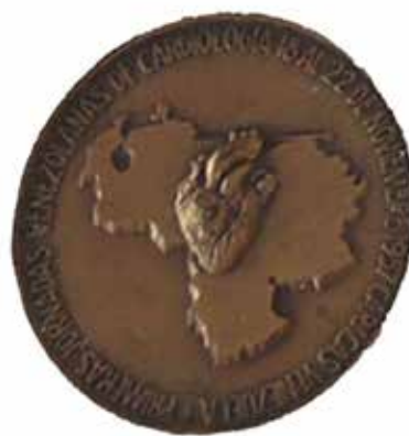
Portada del programa de las Primeras Jornadas Venezolanas de Cardiología y medalla conmemorativa.