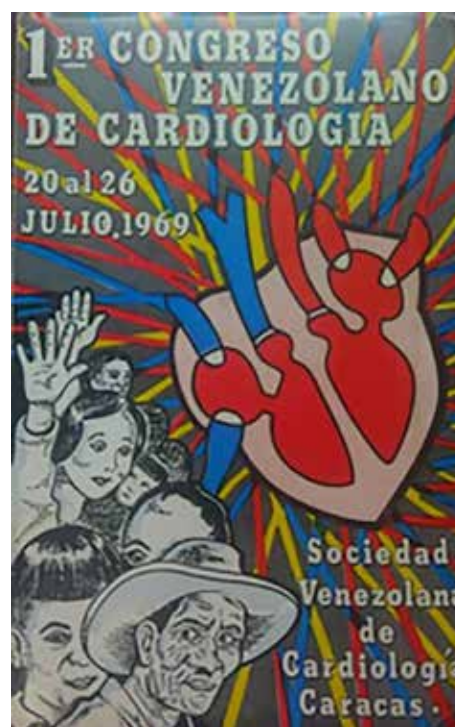
Portada el programa del I Congreso Venezolano de Cardiología